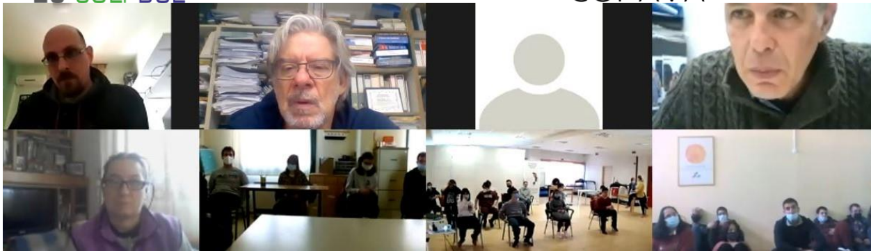
BENDRO KŪRIMO SESIJA GRAIKIJOJE su EDRA ir NKUA