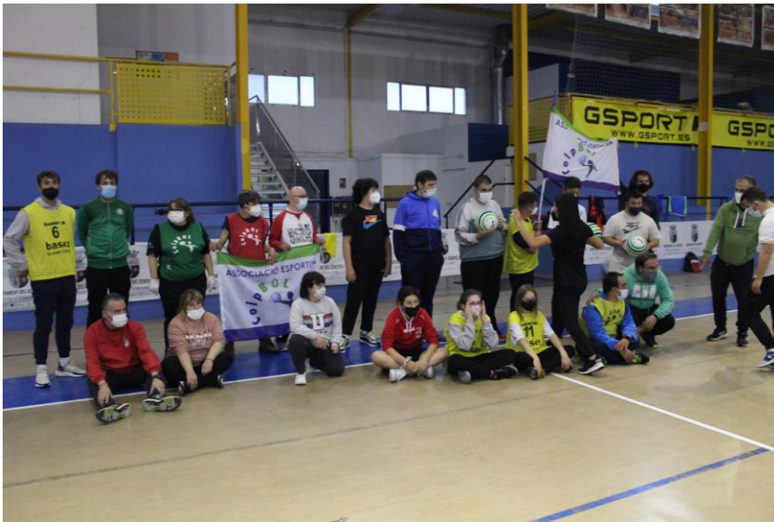
BENDRO KŪRIMO SESIJA ISPANIJOJE su COPAVA ir Associació Esportiva COLPBOL

Šis projektas finansuojamas remiant Europos Komisijai. Šis leidinys atspindi tik autorių požiūrį, todėl Komisija negali būti laikoma atsakinga už bet kokį jame pateikiamos informacijos naudojimą.