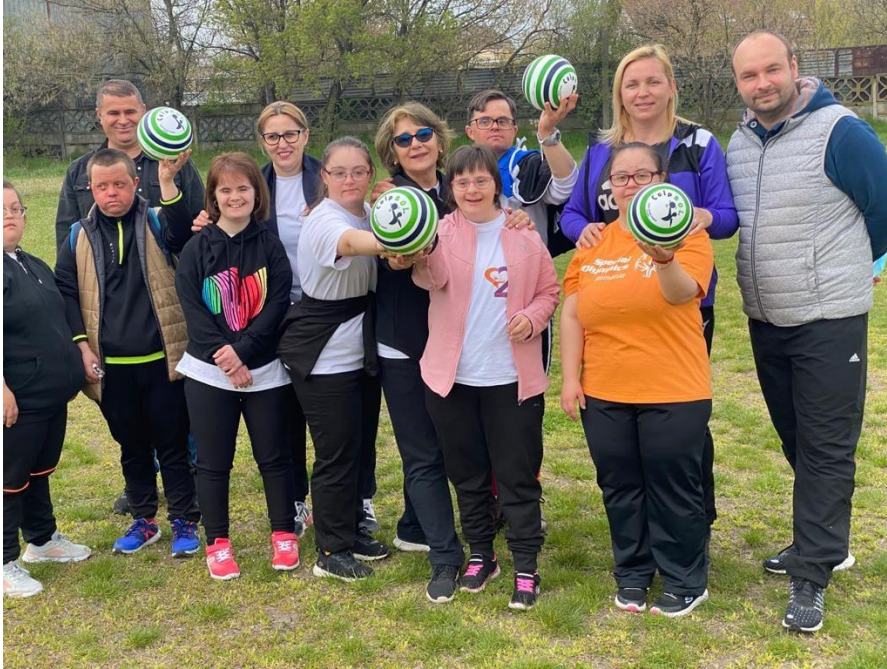
BENDRO KŪRIMO SESIJA RUMUNIJOJE IN ROMANIA su ALDO-CET ir University of Craiova